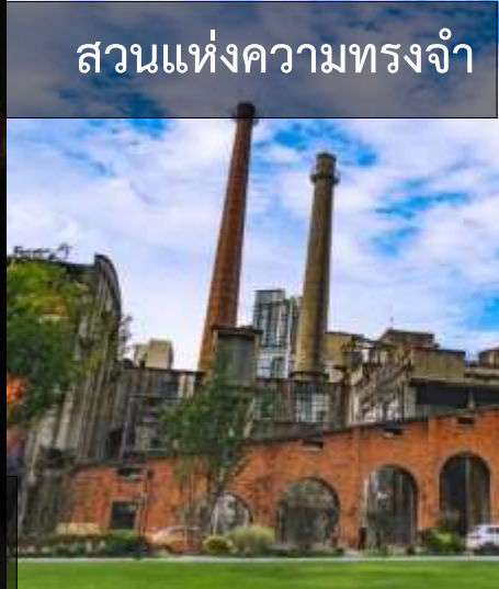
สวนแห่งความทรงจำ