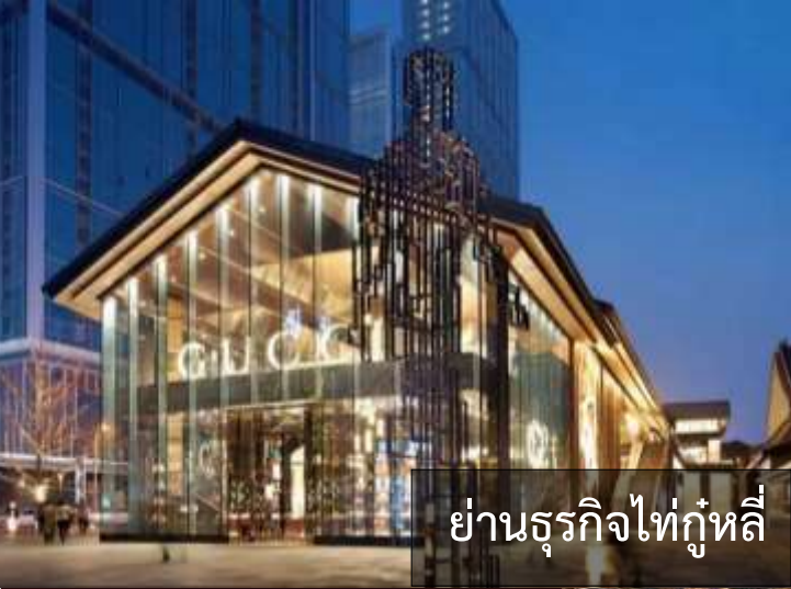
ย่านธุรกิจไท่กู่หลี่