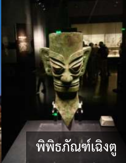
พิพิธภัณฑ์เฉิงตู