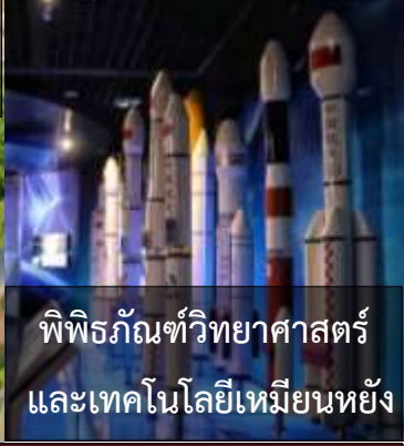
พิพิธภัณฑ์วิทยาศาสตร์และเทคโนโลยีเหมียนหยัง