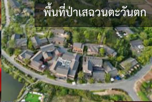
พื้นที่ป่าเสฉวนตะวันตก