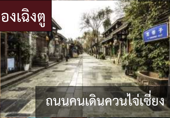
ถนนคนเดินควนโจ้เซียง