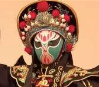
ท้องเฉิงตู