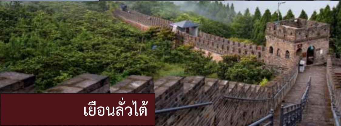
กำแพงเมืองจินจินหลง