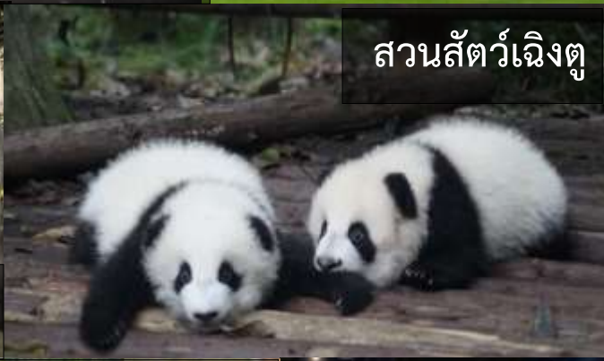
สวนสัตว์เฉิงตู