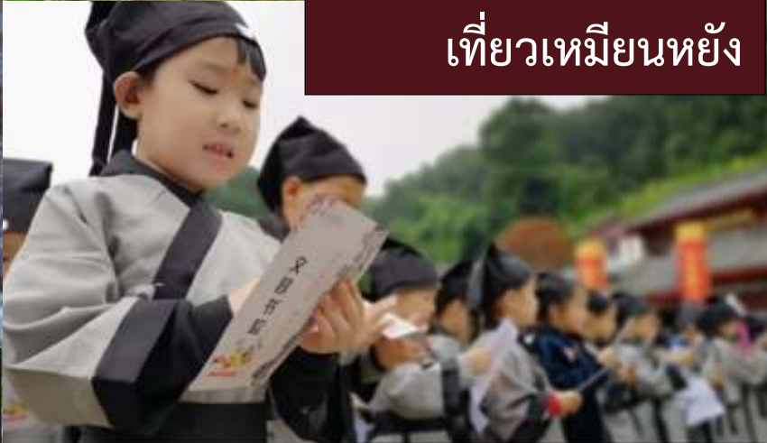
เที้ยวเหมียนหยัง