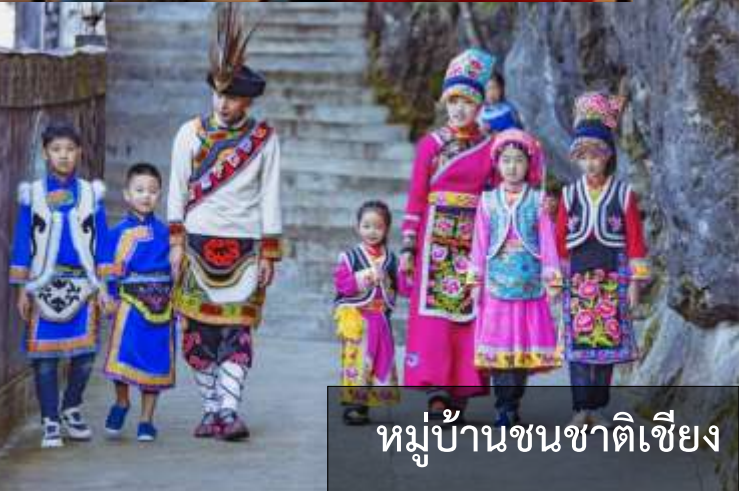
หมู่บ้านชนชาติเซียง